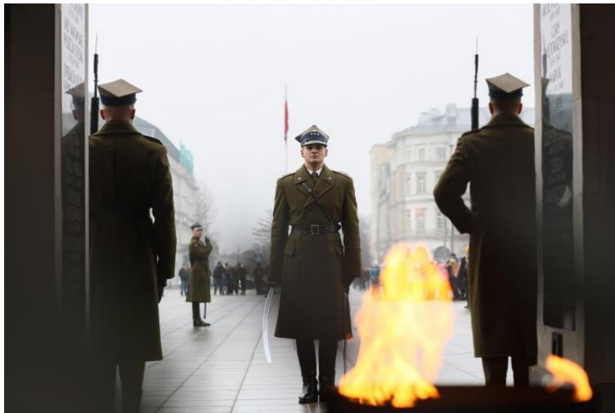
Grób Nieznanego Żołnierza w 2025 r.