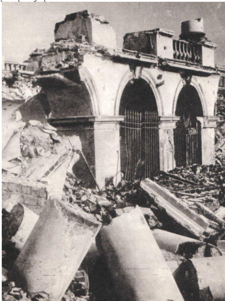
Pałac Saski w Warszawie zniszczony przez Niemców w 1944 roku, fot. Jan Bułhak (S. Jankowski, A. Ciborowski „Warszawa 1945 i dziś”, Warszawa 1971)

Dla mieszkańców zrujnowanej stolicy ocalały grób pośród morza gruzów był przejmującym symbolem ciągłości i nadziei – dowodem, że pamięć o poległych przetrwała najcięższą wojnę.