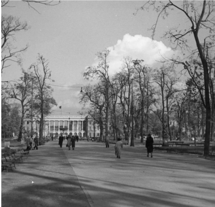
Grób Nieznanego Żołnierza w 1938 r.