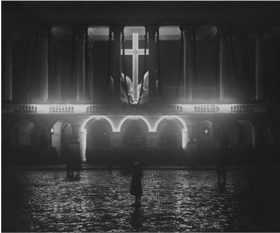
Grób Nieznanego Żołnierza 1 listopada 1926 r.

Lekcja zakończyła się refleksją wspólną – uczniowie i nauczyciel omawiali, jak ważne są symbole narodowe, jak kształtują poczucie tożsamości i odpowiedzialności za dziedzictwo narodowe, oraz jak historia Grobu pokazuje siłę pamięci w trudnych momentach dziejowych.