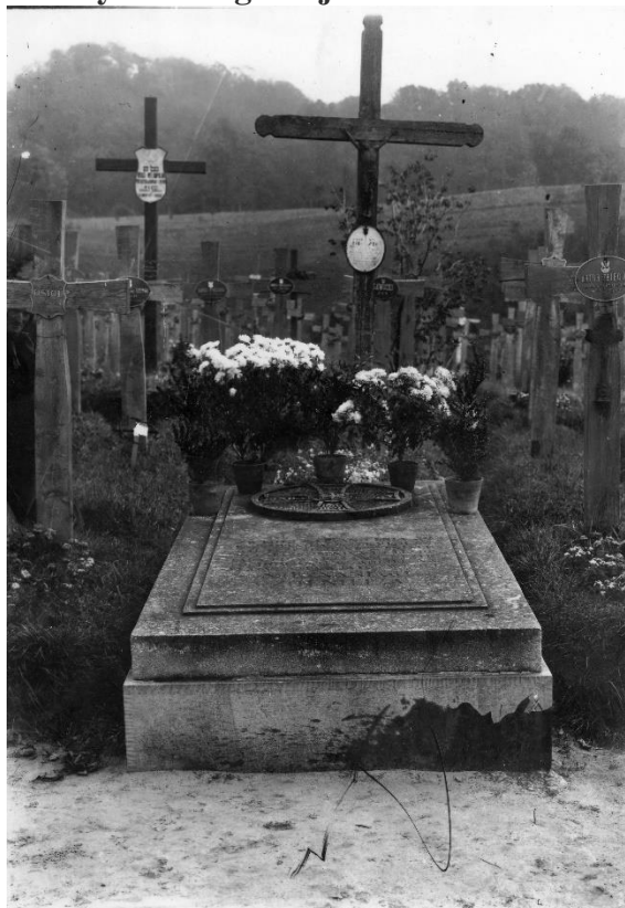
Grób Nieznanego Żołnierza na Cmentarzu Obrońców Lwowa

Po kilku latach przygotowań i dyskusji przystąpiono do realizacji przedsięwzięcia. Ministerstwo Spraw Wojskowych wybrało drogą losowania jeden z historycznych frontów, z którego miałyby pochodzić symboliczne szczątki. Los wskazał na Lwów – miasto, gdzie w latach 1918–1919 toczyły się zaciekle walki o polską niepodległość. Obrona Lwowa miała głęboki wymiar symboliczny, gdyż do walk w 1918 roku stanęła również młodzież i dzieci (słynne Orłęta Lwowskie). Jesienią 1925 roku z Cmentarza Obrońców Lwowa wydobyto trzy trumny ze szczątkami niezidentyfikowanych żołnierzy, poległych w obronie miasta.