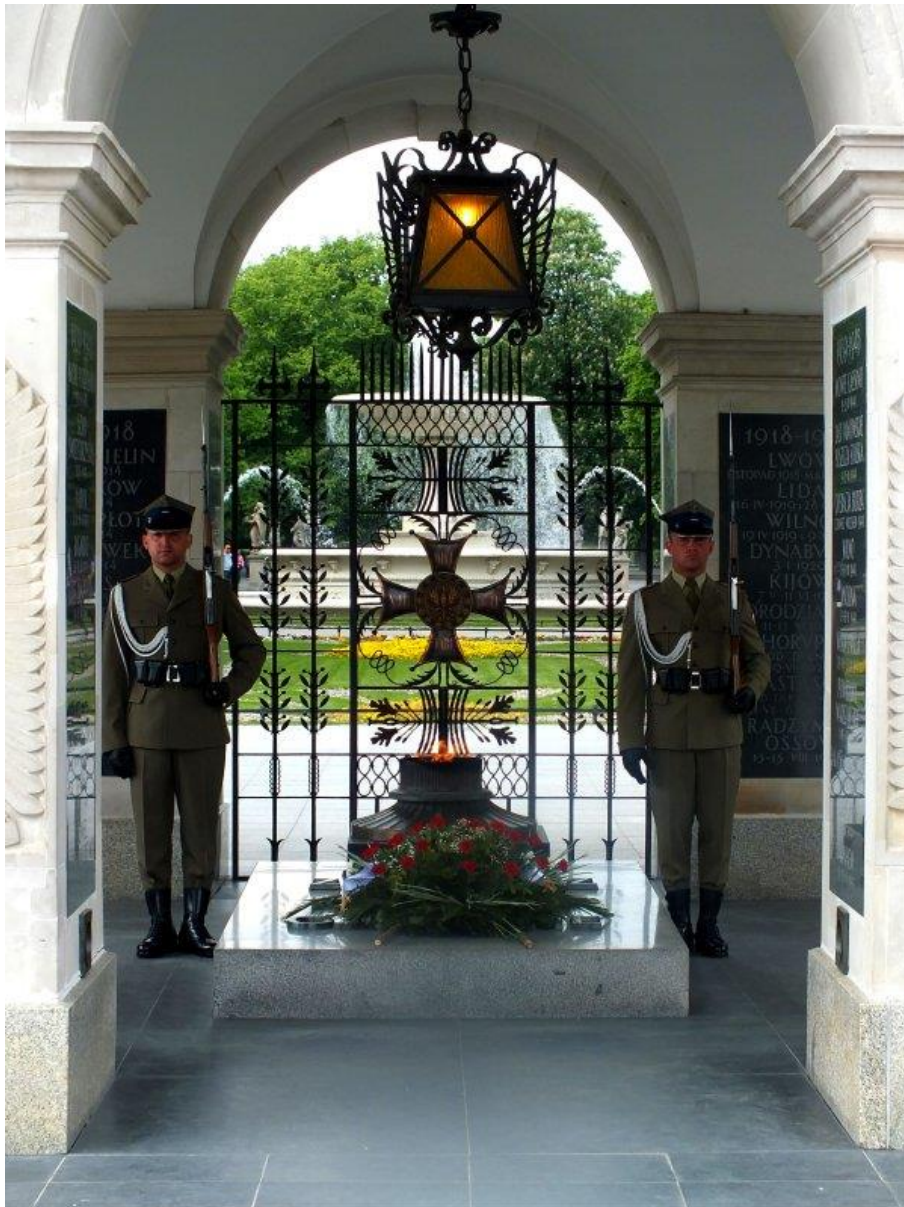
Warta honorowa przy Grobie Nieznanego Żołnierza w Warszawie

Trwałość przesłania warszawskiego Grobu Nieznanego Żołnierza sprawia, że wciąż pozostaje on w centrum uwagi Polaków. W 2018 roku, w setną rocznicę odzyskania niepodległości, pomnik ten otrzymał oficjalnie status grobu wojennego o najwyższej randze, co zapewnia mu szczególną ochronę prawną i opiekę państwa.