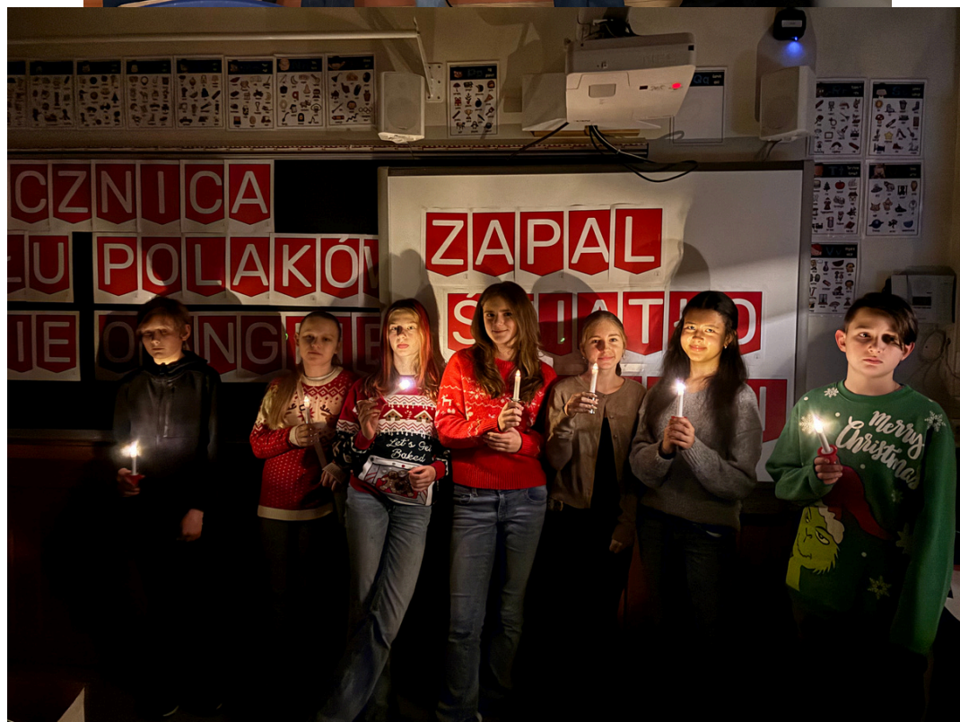
Opracowanie mgr Katarzyna Słabowska-Wachowiak